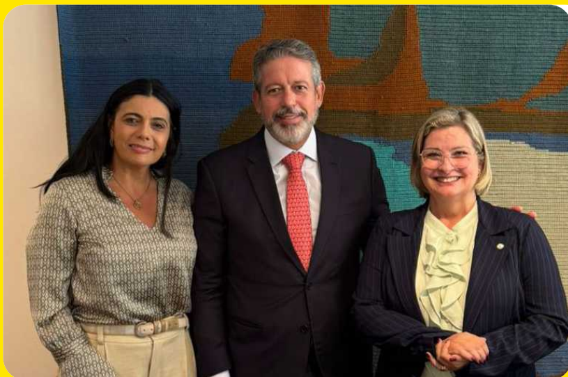
ENCONTRO ARTHUR LIRA

Na Comissão de Agricultura, recebemos também o Ministro Carlos Fávares e o assunto continuou sendo a necessidade da importação de arroz.