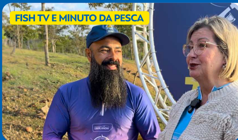
FISH TV E MINUTO DA PESCA